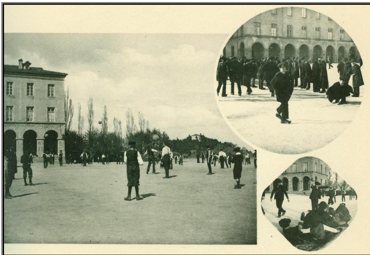
Séminaire de Verrières - Les jeux du ballon et de la glissoire