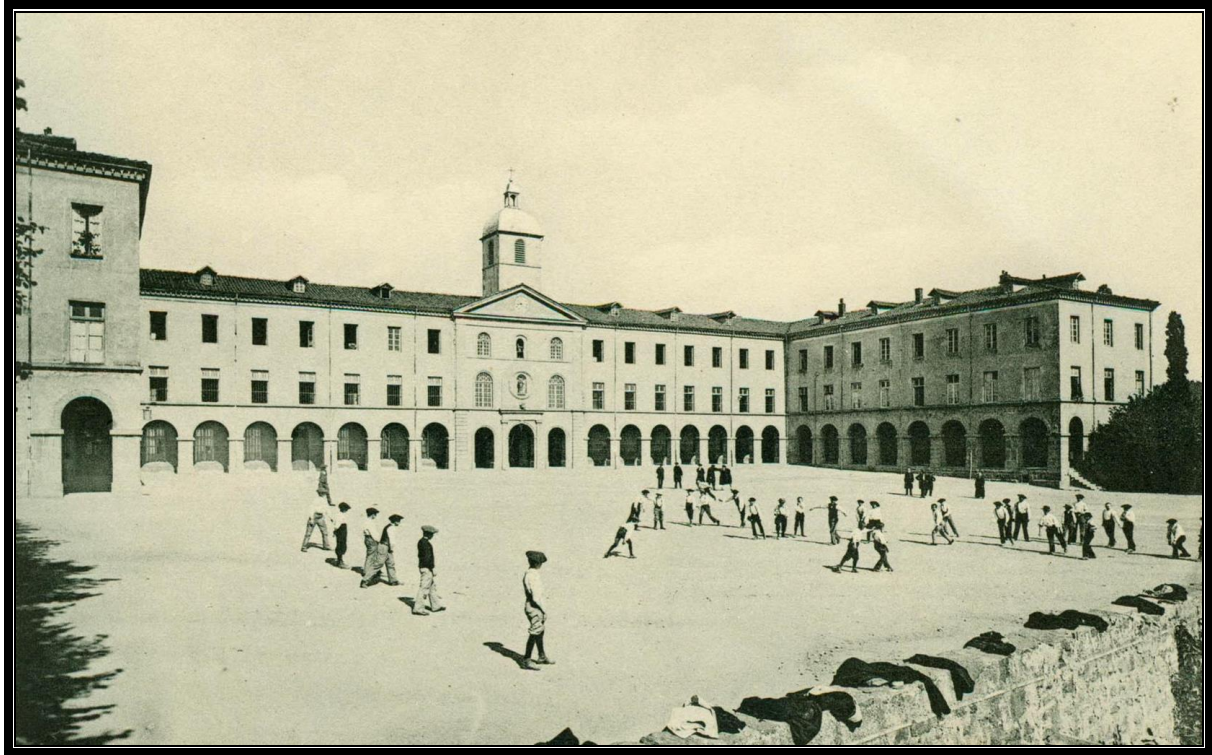
La vaste terrasse du séminaire de Verrières

(extrait de Village de Forez n° 105, avril 2007)