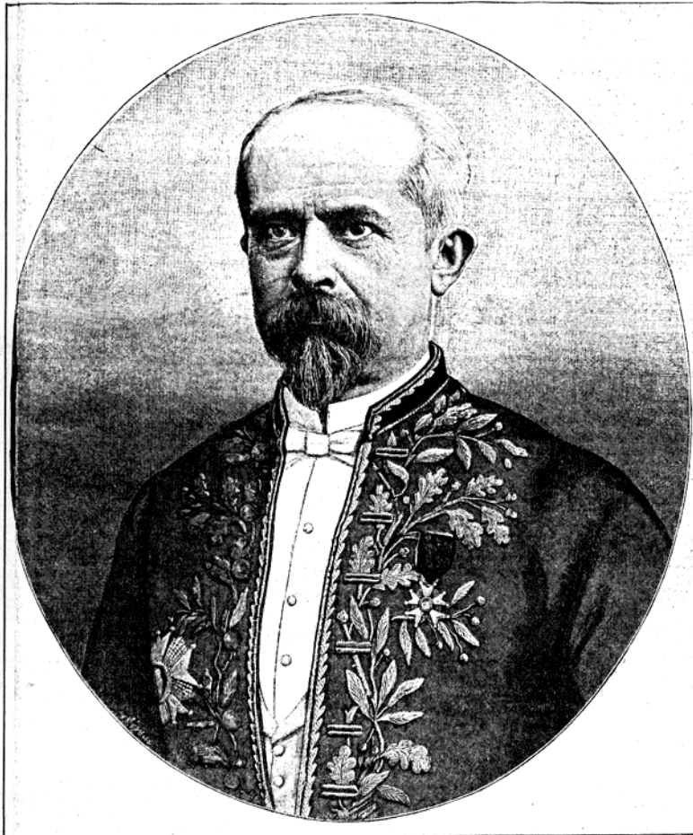
LE NOUVEAU GOUVERNEUR DE L'ALGERIE M. Lépine

Supplément du Petit Journal du 17 octobre 1897