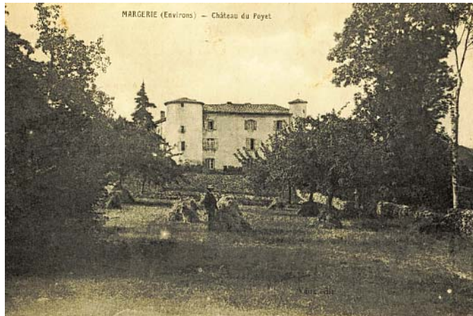
Le Poyet (carte postale ancienne)