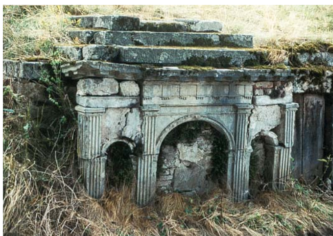
Fontaine du château du Poyet ( du 28 -07-1995)