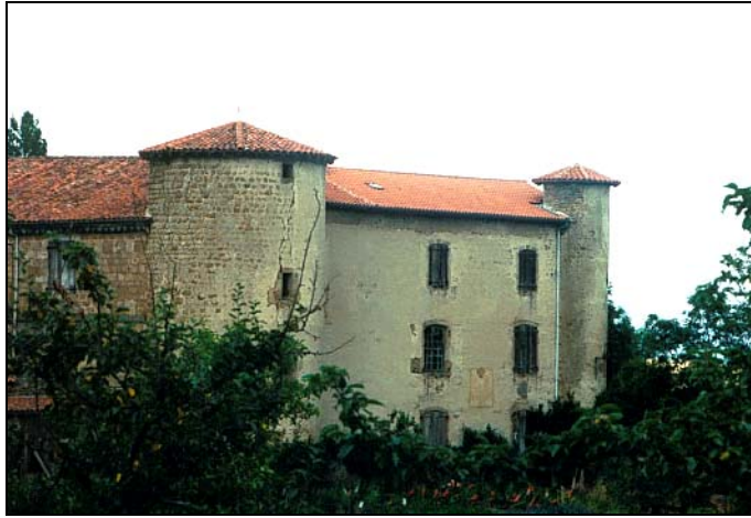
Château du Poyet (cliché J. Barou du 28 juillet 1995)