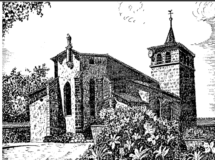
Eglise de Saint-Médard-en-Forez (dessin d'Elie Lavigne)