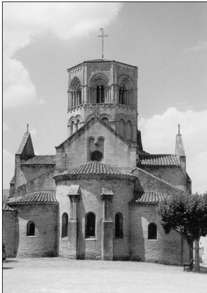
Chevet de l'église de Semur-en-Brionnais