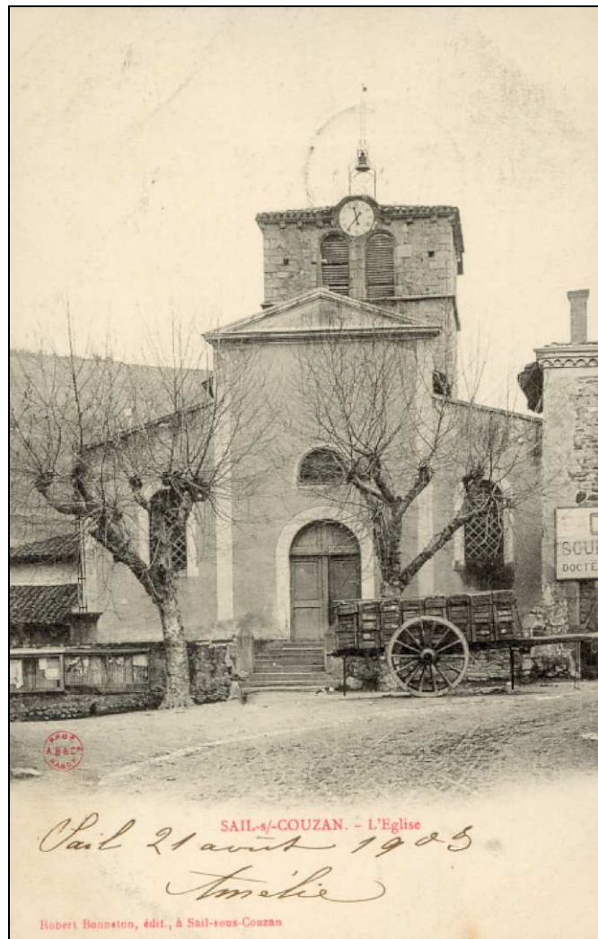
Carte postale : façade église