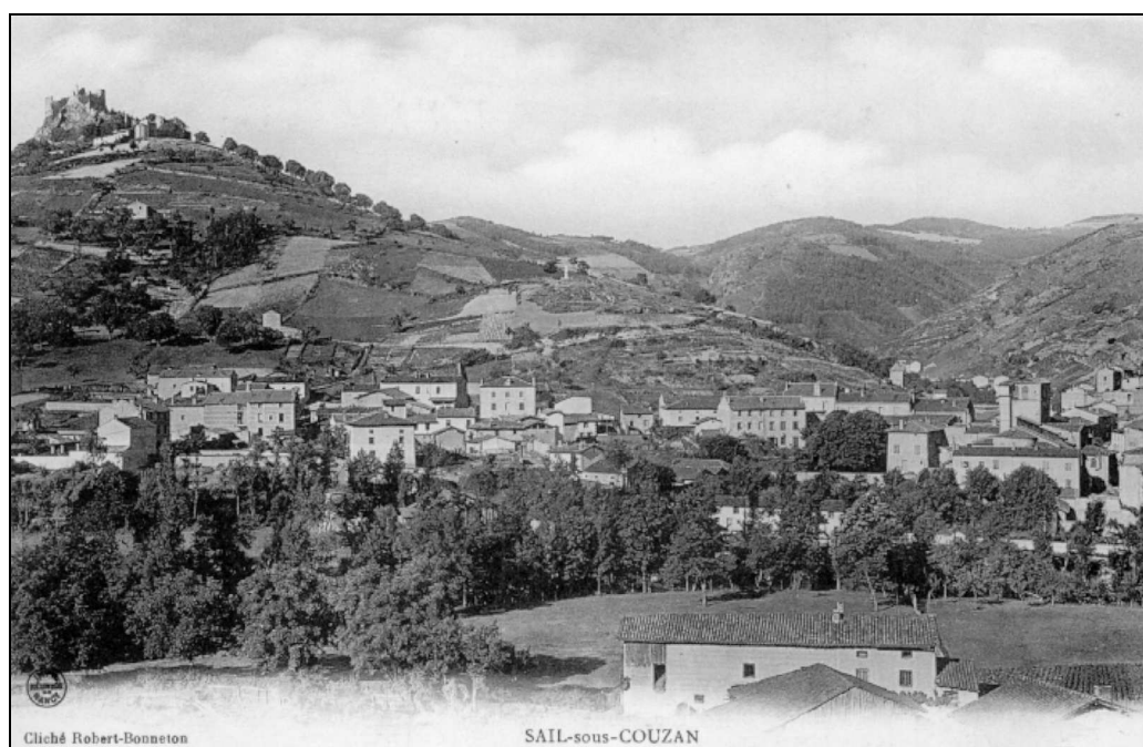
Vue générale de Sail-sous-Couzan

Partons donc à la découverte de l'histoire de ce prieuré bénédictin.