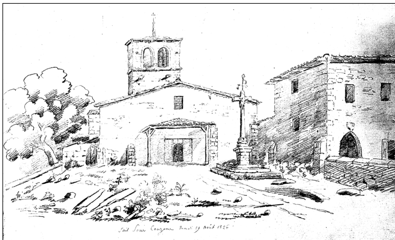
Dessin d'Octave de la Bâtie (Archives de la Diana)

Ces 900 £ étaient réparties comme suit : 400 £ pour les dîmes et chanvres, 250 £ pour les dîmes du vin, 190 £ pour les dîmes sur les prés, 60 £ pour deux jardins, rente noble, la terre, la vigne, les coupes de bois et les bâtiments.