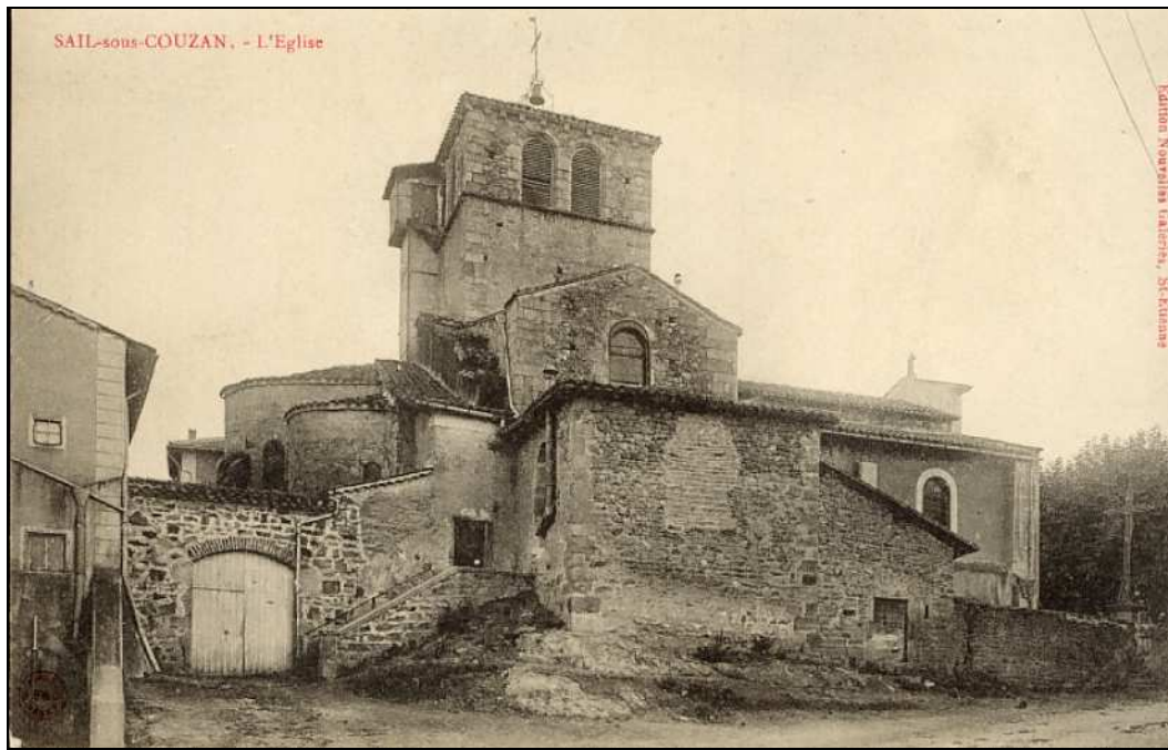
Eglise de Sail-sous-Couzan