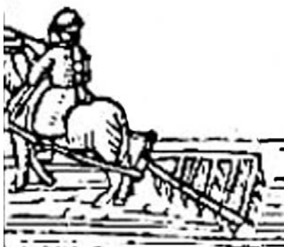
Calendrier des bergers

Il fallait toujours plusieurs "déliées" de deux ou trois heures pour labourer toute la terre. Et à la fin il ne restait que le "chaintre" à faire. C'est-à-dire le tour de la terre, là où le bétail avait marché et piétiné. Comme ça la terre tout entière était bien labourée, Nous pouvions aller délier les bêtes. C'était bien l'heure de les lâcher au pré. Nos vaches avaient bien travaillé et bien mérité d'aller au champ pour manger. Il ne nous restait plus qu'à ranger le joug, les courroies et les coussins. La charrue, elle, avait bien le temps de rester à la terre jusqu'à une autre fois.