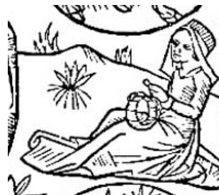
Calendrier des bergers

Nous restions au champ deux heures environ. Nous avions l'heure, ou nous regardions le soleil, ou bien on nous appelait. Et lorsque notre bétail était repu, nous rentrions (nous allions fermer). Nous criions un peu fort : " Ô clôre ô..." Les vaches comprenaient. La première partait en tête, les autres suivaient avec le chien et le berger. En arrivant dans la cour, elles allaient boire au bac (le "bachat"). Le chien était là pour les empêcher de se battre. Puis elles rentraient à l'étable, chacune à sa place. Nous les attachions avec la chaîne à leur crèche. Nous enfermions les brebis et les chèvres et nous donnions un bon quartier de pain au chien : il l'avait bien mérité. Et voilà, notre bétail était fermé jusqu'à une autre fois.