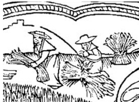
Calendrier des bergers

Il avait un genou sur les gerbes, l'autre jambe étendue. A la fin il fallait faire la pointe, lier les gerbes ensemble dans les derniers tours, bien attacher la pointe et la couvrir de fougères à cause des poules. Le plongeon demeurait quatre à cinq semaines avant d'être rentré.