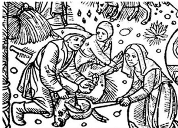
Calendrier des bergers