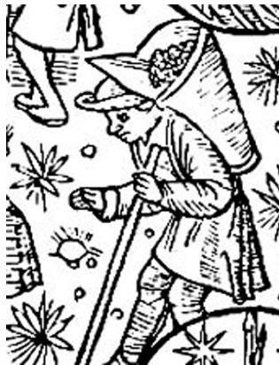
Calendrier des bergers

Les vendangeurs étaient venus à pied et en car. Ils étaient déjà là. On se mettait à table pour souper, et la journée était finie. Les jours suivants, il fallait piler la vendange et la remuer par le guichet jusqu'à ce qu'elle fermente 1 . Parfois nous allions tirer le vin doux au fausset. Il était bien bon, mais il fallait se méfier de ne pas trop en boire. Une fois le vin fait, nous le tirions à la fontaine au bout de la charge, comme je l'ai déjà dit.