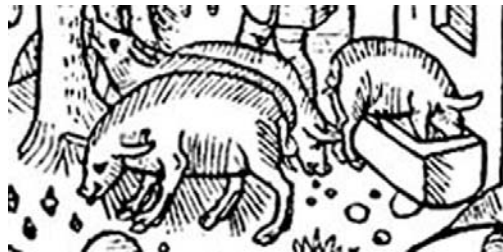
Calendrier des bergers