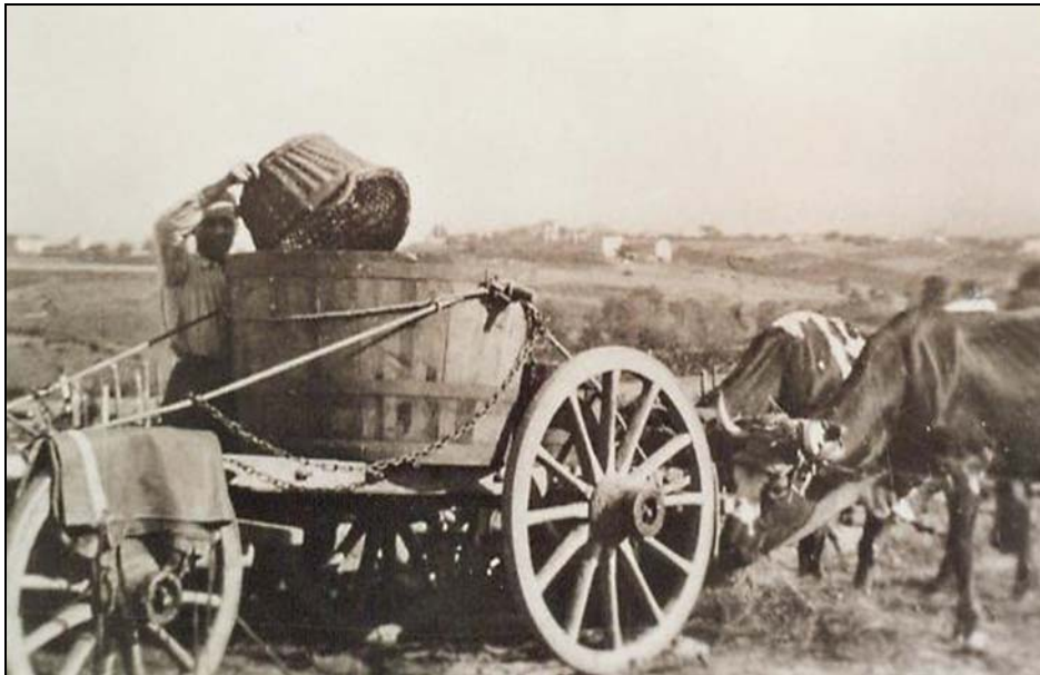
Les vendanges en face de Saint-Georges-Haute-Ville ; c'était en 1940, 1941 ou 1942, à l'occasion d'une petite récolte puisque la benne suffisait.