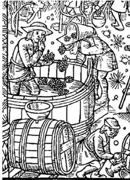
Calendrier des bergers

Lou vindëmö èron vegnu o piè è in car. Eron dedzouo étye. Se bitèvon o trablo po supà, è lo dzourna ère figno. Lou dzour d'opré, fouye pilà lo vindëmo è lo dèmena po le guitze djuko que buyèze 1 . Tsa mouman olèvan tyera le vin dou ô guillu. Ere bian bou, ma se fouye méfia de pa trouo n'in bière. No vé le vin fai, le tyerèvan po lo fontèno doré lo tsardje, coumo z'ai dedzouo dye.