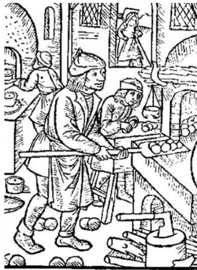
Calendrier des bergers

Fuquè coum'ékin djuk'in dye je nò sin trinto, o pe prè. Mo gran mère vegne veille, obandunè lo patère è le four. Dulpè yevrèran nôtro foreno ô boulongjé que possève è qu'odjuje le pan tu fai è tu fre. E pè tu bèlomin le four s'é dédzatye, lé brique de lo vòto an ébouyo, son couvér s'ét'écroso. Ôro y demouore ma plu lo plache de lo porte, boutsa ô de brique. Vetyo lo tristo fye de nôtron four.