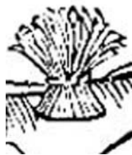
Calendrier des bergers

Il ne reste plus qu'à passer le râteau pour ramasser les pailles et les épis cassés. Vous leur donnez quelques coups de fléau, vous en faites un paquet avec un lien, et vous le jetez sur la fenière pour les rations. Un coup de râteau sur l'aire pour pousser le grain au bord, et vous avez achevé de battre votre première "paillée". Il vous a fallu trois quarts d'heure à peu près, peut-être un peu plus.