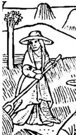
Calendrier des bergers

Parfois il fallait se dépêcher pour aller chercher une autre charrée ou deux. Si le temps menaçait nous n'avions pas le temps de goûter. On était toujours pressé. Aussi nous achevions la journée bien fatigués. Que voulez-vous ? C'était comme ça... Il n'y avait pas autre chose à faire.