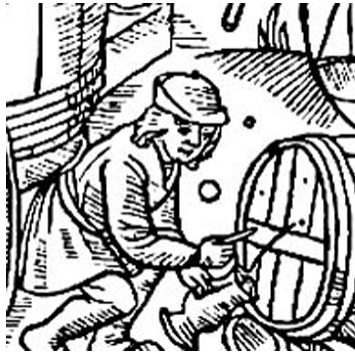
Calendrier des bergers

Le vin était quelque chose de vivant, disait un vieux du pays. Pas étonnant s'il donnait tant de travail et de souci. Mais, que voulez-vous, c'était notre vin que nous buvions. Nous l'avions récolté ; même si ce n'était pas du beaujolais ou du bordeaux, c'était le nôtre. Mon père en étant très fier. Et il avait bien raison.