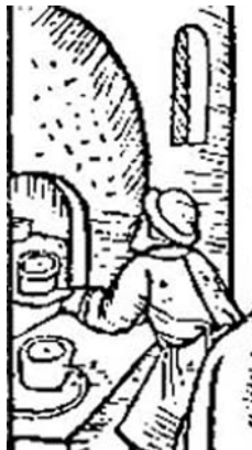
Calendrier des bergers

Ce fut comme ça jusqu'en 1930, à peu près. Ma grand-mère prenait de l'âge, elle abandonna la maie et le four. Depuis nous livrâmes notre farine au boulanger qui passait et qui amenait le pain tout fait et tout frais. Et puis... tout doucement le four s'est désagrégé, les briques de la voûte se sont effondrées, le toit s'est écrasé. Maintenant il ne reste plus que l'emplacement de la porte, bouché avec des briques. Voilà la triste fin de notre four.