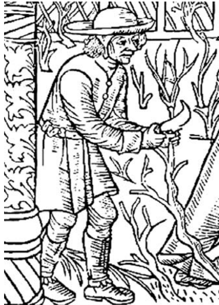
Calendrier des bergers

Le vin ère kok'ofaire de vivan , dyeje in vieu dô poyi . Pa étunan que dunève tan de trovè è de suche . Ma , ke vouyé tj, ère nôtron vin que beyan ; l' oyan cuye , mémou ch'ère pa de bôjolè ou de bordô , ère le nôtru . Mon père n'ère bian fièru . Et oye bian résu .