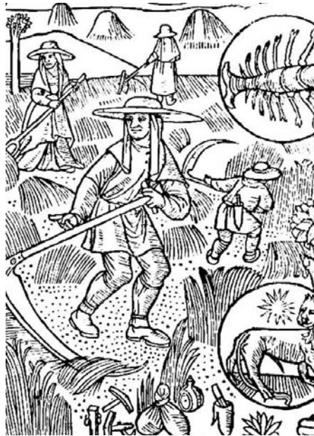
Calendrier des bergers

Tsa couq fouye se dépotsa po la kar n'otro tsora ou douè. Che le tin menocève oyan pa la tin de goutoruna. Na z'ère tudzour in présso. Ôche, nan z'otsobève le dzour fran recrey. Ke vouyé tj ? Ere coum'ékin... Yoye pa otro veyà o faire.