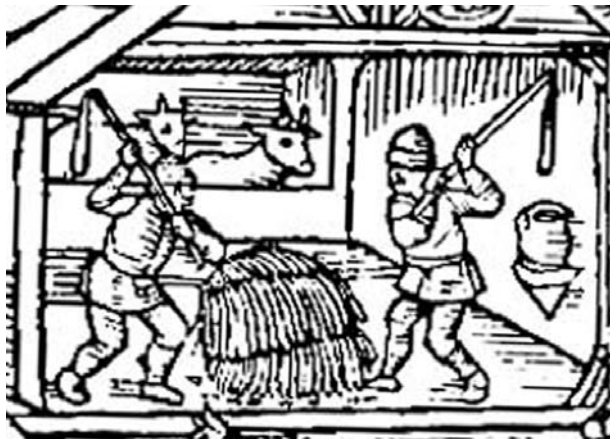
Calendrier des bergers

Manque ma plu possa le ratè po omossa le z'époyourdjé, céto dyere lé paille è le z'épiè cossè. Y foutyé kokou couò d'ékoussou, n'in fojé in yossu avec in yan, è le djeta chu lo fenère po lo mécla. In couò de ratè chu le si de grandje po rossa le grouò, è oyé otsobo vôtro prumère poilla. Vou z'ò fouyu trè kar d'uro o pe prè, beyo in pouo mè.