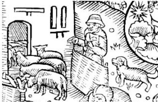
Calendrier des bergers

Demourèvan in tsan douè zure o pe pré. Oyan l'uro, ou ovisèvan le sulè, ou be nou sunèvon. E kan nôtron bétya ère sølu, olèvan clöre. Gôlèvan in pouo fôr : "Ô clöre ô... ô clöre ô !" Lé vatse compregnon. Lo prumère filève, in tète, le z'otre chudyon, avec le tche è le bordjé. In orivan po lo cour olèvon biöre vé le batsa. Le tche ère étye po le z'impotsa de se batre. Opré, rintèvon vé l'étrablu, tsakuno o louro plache. Le z'ototsèvan ô lo tsèno o louro crèpye, clôyan lé fè è lé tchôre è dunèvan in bon truya de pan ô tche : l'oye bian mérito. E vetyo, nôtron bétya ère clôyu, djuko notre vè.