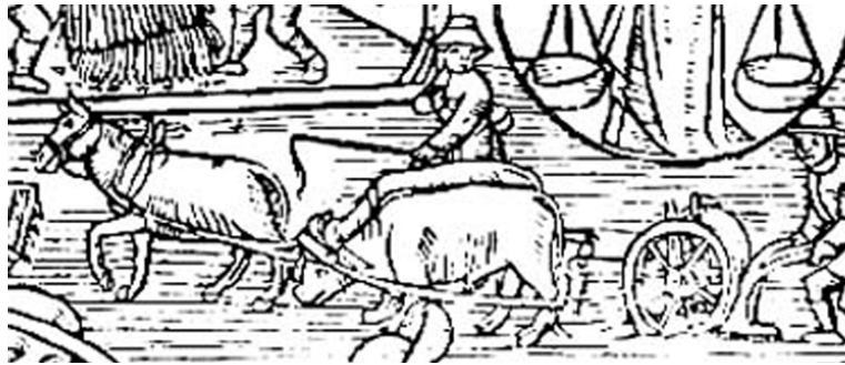
Calendrier des bergers

Fouye tudzour plujure déyè de dou tré z'ure po tsorulo tuto lo taro. E o lo fye, demourève ma lo tôvèlo o faire. C'èt'o dyere lou tour, von le betya oye viro è piotuno. Coum'ékin, tuto lo taro ère bian tsorula. Pouyan la déya ; ère bian l'uro de latsā le betya po le prouo. Nôtré vatse oyon bian trovoillo è bian mérito d'ola in tsan po mindza. Nou demourève ma plu o étrema le dzu, lé dzoucle è lou fronto. Lo tsoruo, yèlo, oye bian le tin de demoura po lo taro djuko n'otro vè.