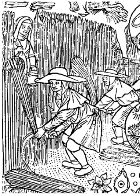
Calendrier des bergers